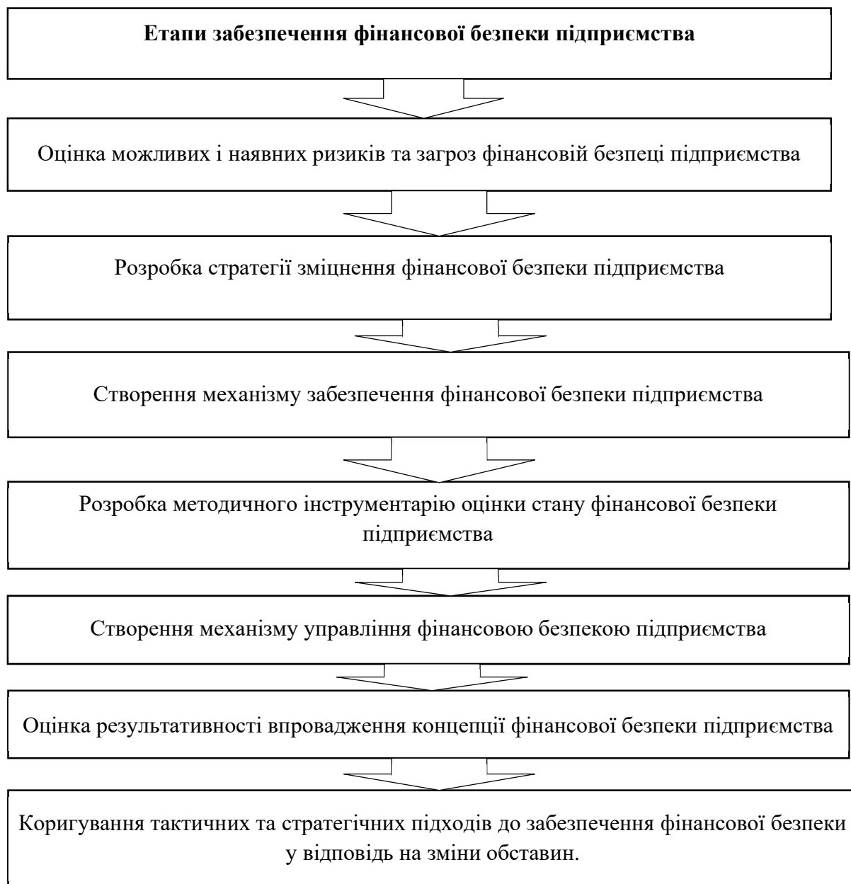
Рис. 3 Етапи забезпечення формування та реалізації фінансової безпеки підприємства пасажирського транспорту