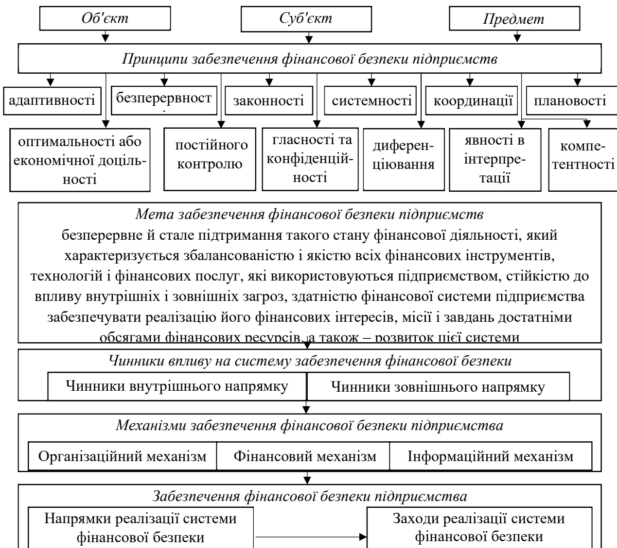
Рис. 2 Концептуальні засади формування фінансової безпеки підприємства пасажирського транспорту